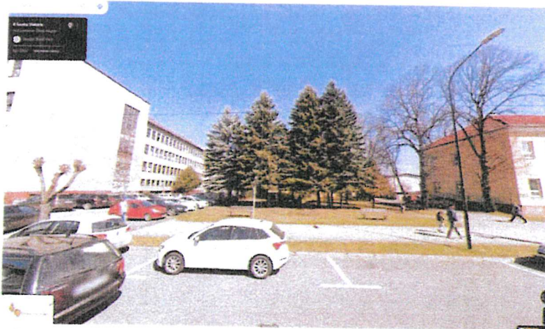
Obr. č.2: Výrez z Google Street View