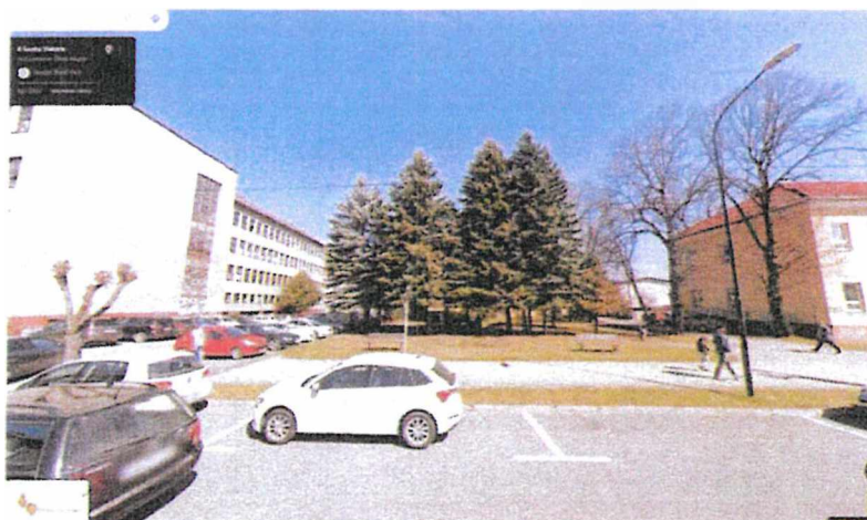
Obr. č.2: Výrez z Google Street View